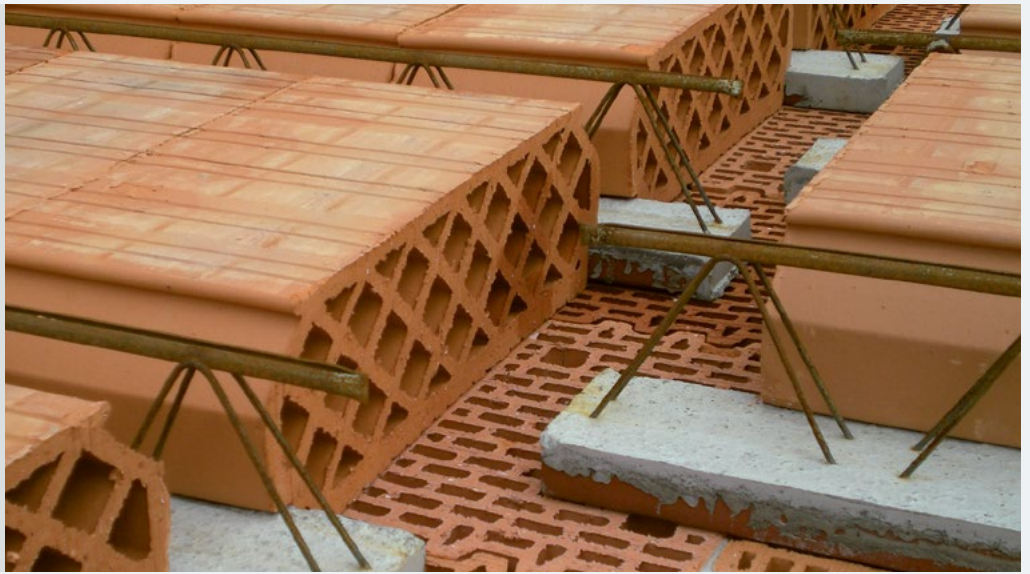
Symbolfoto ohne Mauersperrbahn