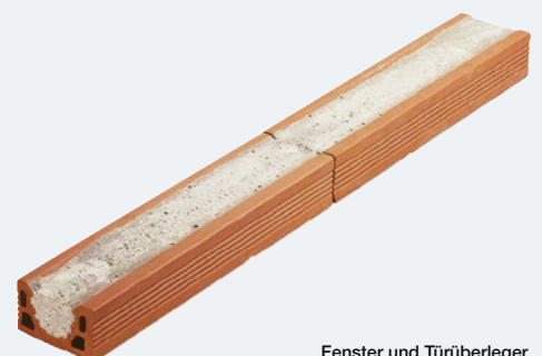
Fenster und Türüberleger